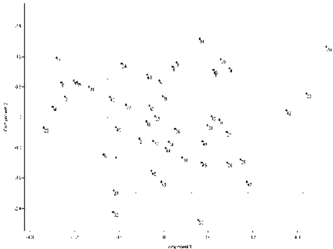
شکل ۲ - نمودار دوبعدی پراکنش ژنوتیپ‌ها بر مبنای مؤلفه‌های اول و دوم حاصل از تجزیه به مؤلفه‌های اصلی